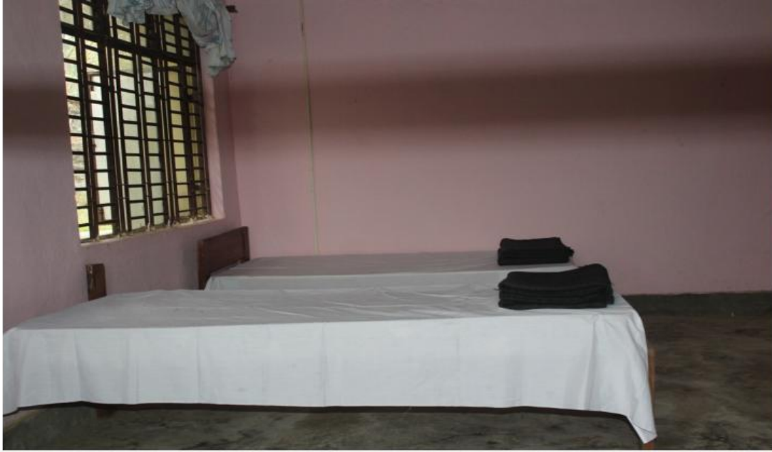
मिति २०७६।१२।१२ गते ६० बेड क्षमताको सि.टि.ई.भि.टि. देउरालीमा क्वारेन्टाईनको स्थापना