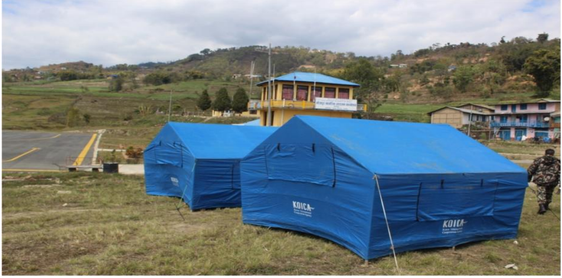
मिति २०७६।१२।०६ गते टक्सार एयरपोर्टमा स्थापना गरिएको हेल्थ डेक्स

गरिएको छ । अन्य जिल्ला तथा विदेशबाट आएका नागरिकहरूलाई हतुवागढी गाउँपालिकाले अनिवार्य होम क्वारेण्टाइनमा राख्नको साथै संक्रमणको सम्भावना भएका व्यक्तिहरू होम क्वारेण्टाइनमा बसेको घरमा रातो झण्डा र अन्य घरमा पहेँलो झण्डा राख्ने व्यवस्था गरेको छ । त्यसै गरी सो गाउँपालिकाले उदयपुर, सुनसरी तथा धनकुटा जिल्लाहरूबाट उक्त पालिकामा प्रवेश गर्ने नाकाहरूमा उच्च निगरानी तथा नियन्त्रण बढाउन स्वयंसेवकहरू परिचालन गरेको छ ।