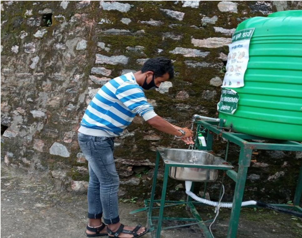
जिल्ला प्रशासन कार्यालय प्रवेशद्वारमा हात धुनको लागि राखिएको साबुन पानी