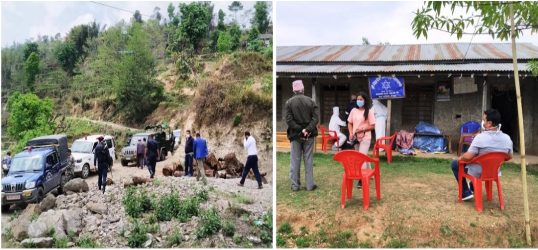
मिति २०७७/०९/०८ गते जिल्ला कमाण्ड पोष्ट भोजपुरले षडानन्द न.पा. र अरुण गा.पा. स्थित Quarantine र Isolation स्थलहरूको स्थलगत अनुगमन