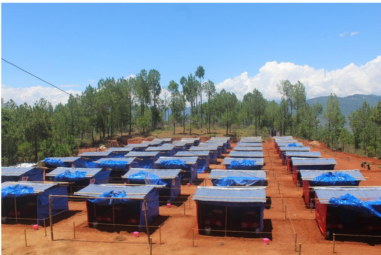
जरायोटारमा निर्माण गरिएको होल्डिङ सेन्टर