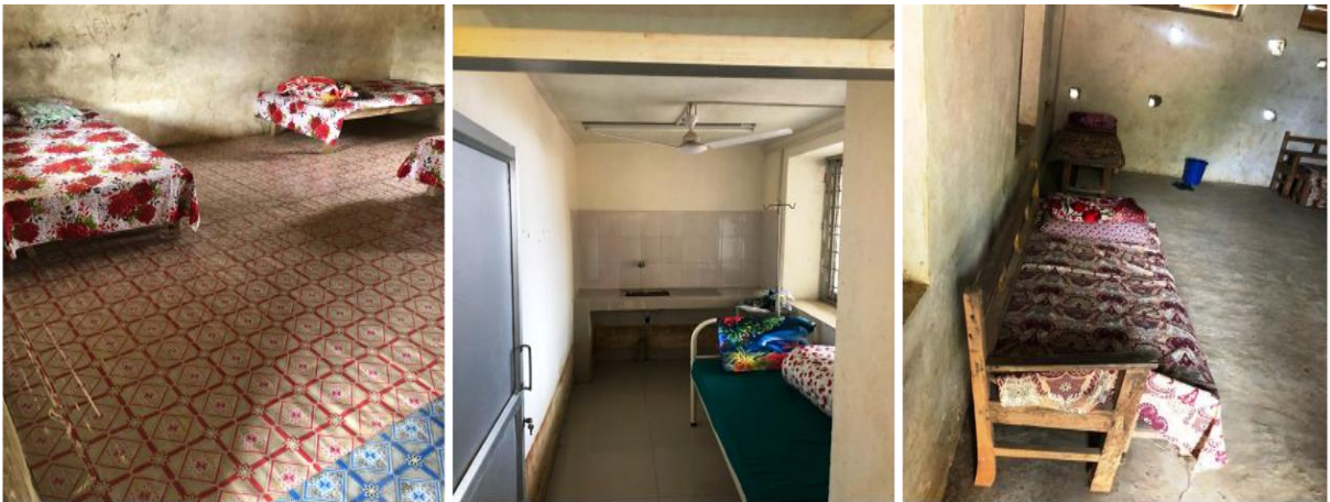
मिति २०७७/०९/०८ गते जिल्ला कमाण्ड पोष्ट भोजपुरले रामप्रसादराई आमचोक र हतुवागढी गा पा मा रहेको Quarantine र Isolation स्थलहरूको स्थलगत अनुगमन