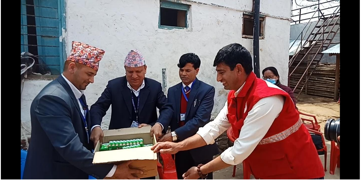
मास्कर र स्यानीटाइजर वितरण गर्नु हुँदै प्र.जि.अ.