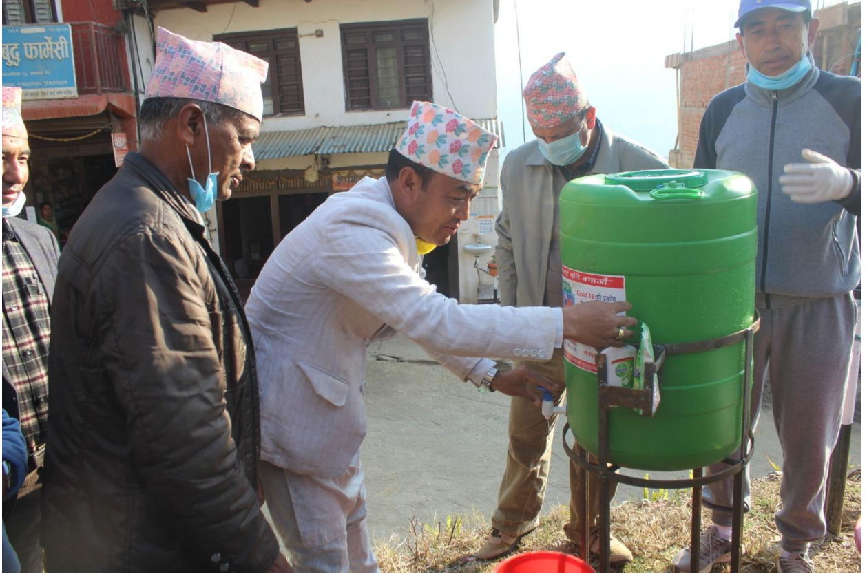
भोजपुर बजार स्थित जिरोप्वाइन्टमा हात धुनको लागि राखिएको साबुन पानी