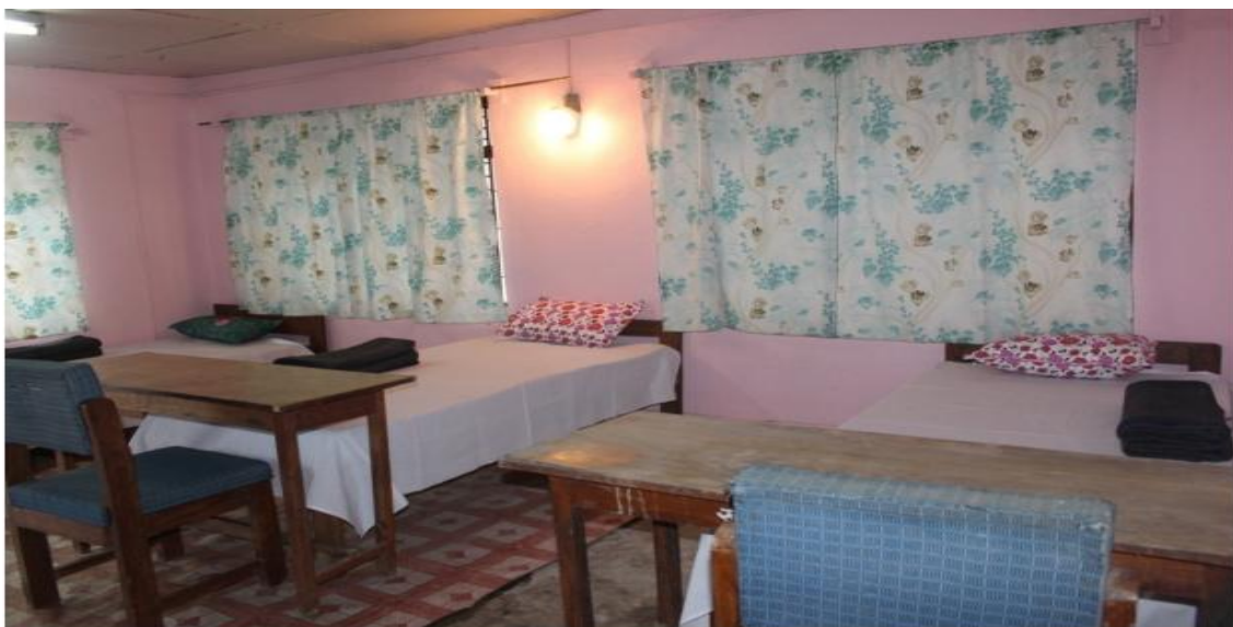
मिति २०७६।१२।०८ गते (पर्यटन सुचना केन्द्र टक्सार) मा ४० बेड क्षमताको क्वारेन्टाईनको स्थापना